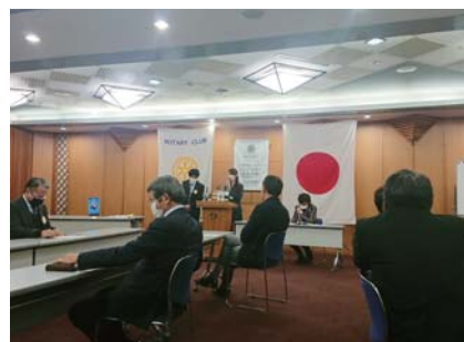
2023～2024年度会長・幹事紹介