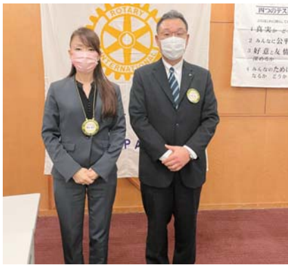
2024～2025年度会長 2025～2026年度会長